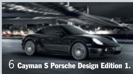
6 Cayman S Porsche Design Edition 1.