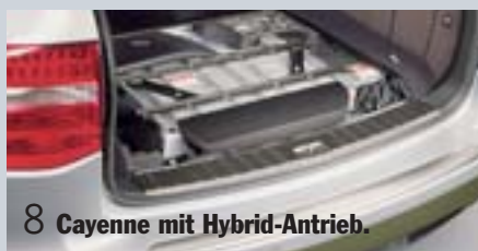
8 Cayenne mit Hybrid-Antrieb.

Ein starkes Paket. Gebrauchte der AVP-Gruppe.