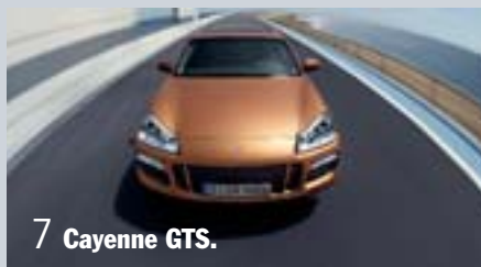
7 Cayenne GTS.