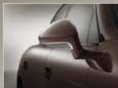
Außenspiegelunterschalen in Platinsilber.

Im Innenraum sorgt die zweifarbige Teillederausstattung in Schwarz und Luxorbeige sowie die Sitzheizung vorne für Komfort. Das SportDesign Lenkrad ist in Verbindung mit PDK oder Tiptronic ein weiteres serienmäßiges Highlight. Und den richtigen Weg schlagen Sie dank des Porsche Communication Managements inkl. Navigationsmodul ein. Am Ziel angekommen ist auf den ebenfalls serienmäßigen ParkAssistenten Verlass. Welches Ziel Sie auch immer ansteuern: Den richtigen Weg haben Sie bereits gewählt. Den Porsche Weg. Er hält noch weitere Individualisierungsmöglichkeiten für Sie bereit. Und lässt dabei keine Wünsche offen. Erleben Sie den Feinschliff – mit der Porsche Panamera Platinum Edition.