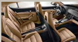
Zweifarbige Teillederausstattung in Schwarz und Luxorbeige.