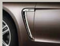
Seitliche Luftauslässe in Platinsilber.