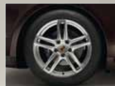
19-Zoll Panamera Turbo Räder mit farbigem Porsche Wappen.

Kraftstoffverbrauch/ Emissionen Porsche Panamera Platinum Modelle (in l/100 km): außerorts 7,8 – 5,6 · innerorts 16,4 – 8,1 · kombiniert 11,3 – 6,3 · CO 2 - Emission in g/km 265/167 · Effizienzklasse C – G