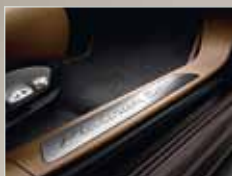
Einstiegsleisten mit Schriftzug „Platinum Edition“.