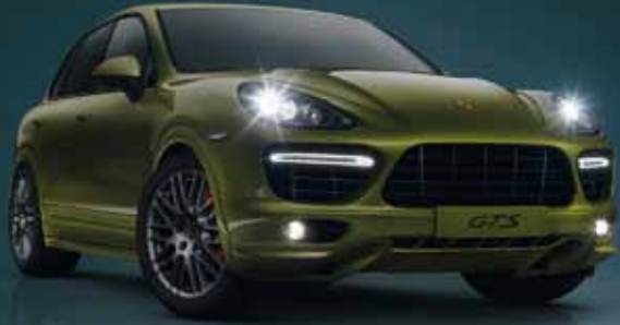
Der neue Porsche Cayenne GTS ist da.